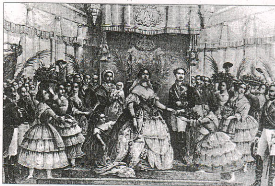
Grabado de un acto oficial de Isabel II, durante la estancia en Alicante.

La dirección de esta página web conmemorativa es www.150ferrocarrilalicante.gva.es y en ella se puede navegar por documentos originales, como las concesiones que se dieron a empresas privadas para construir la línea, "animaciones donde se recrea la construcción de uno de los puentes, obra maestra de ingeniería de la época; videos sobre el paisaje