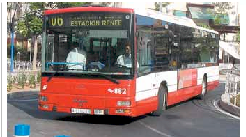
El sistema TAM incluirá nuevas líneas con recorridos interurbanos.

Su trazado será común a la Línea 1 hasta cruzar la avenida de Dénia. De ahí, girará por Alcampo hasta el Bulevar del Pla, Hospital, Virgen del Carmen, Ronda Norte, avenida de Novelda y Universidad. Sus dos tramos finales estarán en obras en breve y funcionará en 2007-08.