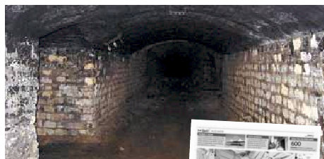
Una de las antiguas galerías.